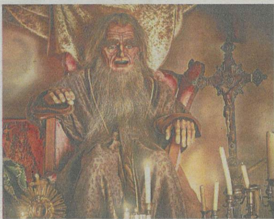
De Efteling-attractie Villa Volta heeft bijgedragen aan de populariteit van de bokkenrijders.

Die verhalen zorgden er ook voor dat de legende buiten Limburg voortleefde. „Het verhaal