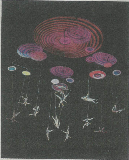
In 2011 opende Voala Project het festival.