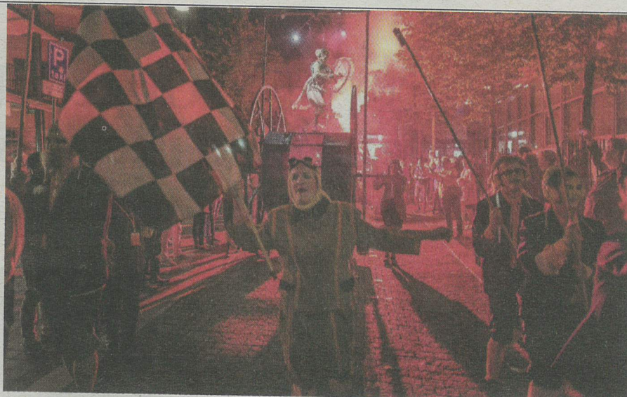
Opening 2017, door Theater Titanick.