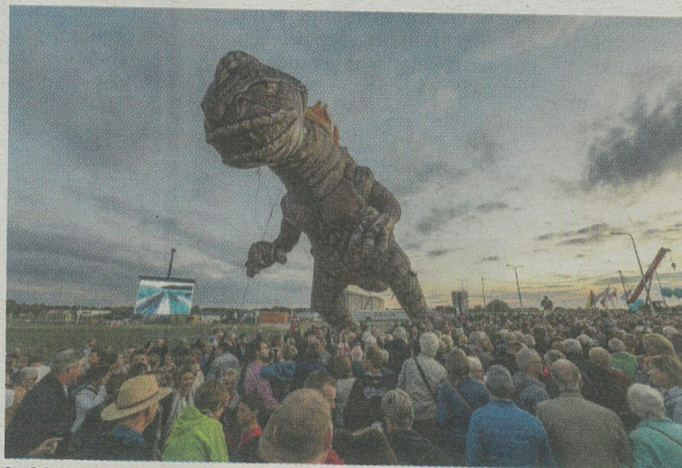
In 2019 verrasten de Plasticiens Volants het publiek met een gigantische opblaas-Godzilla.