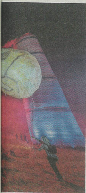
Volants en Groupe F.

(2015, Plasticiens Volants) – het opblaasmonster Godzilla keert nog altijd terug als mascotte van Heerlen.