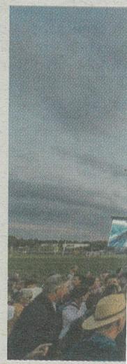
In 2019 verraste de opblaas-G