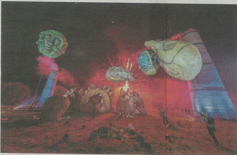
De openingsact in 2015 door de gezelschappen Plasticiens