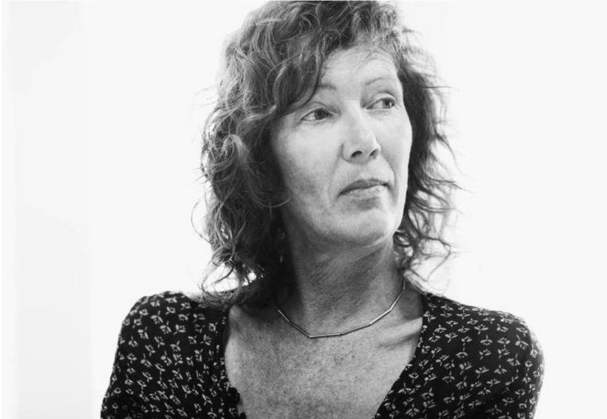
De Vlaamse actrice Chris Nietvelt.