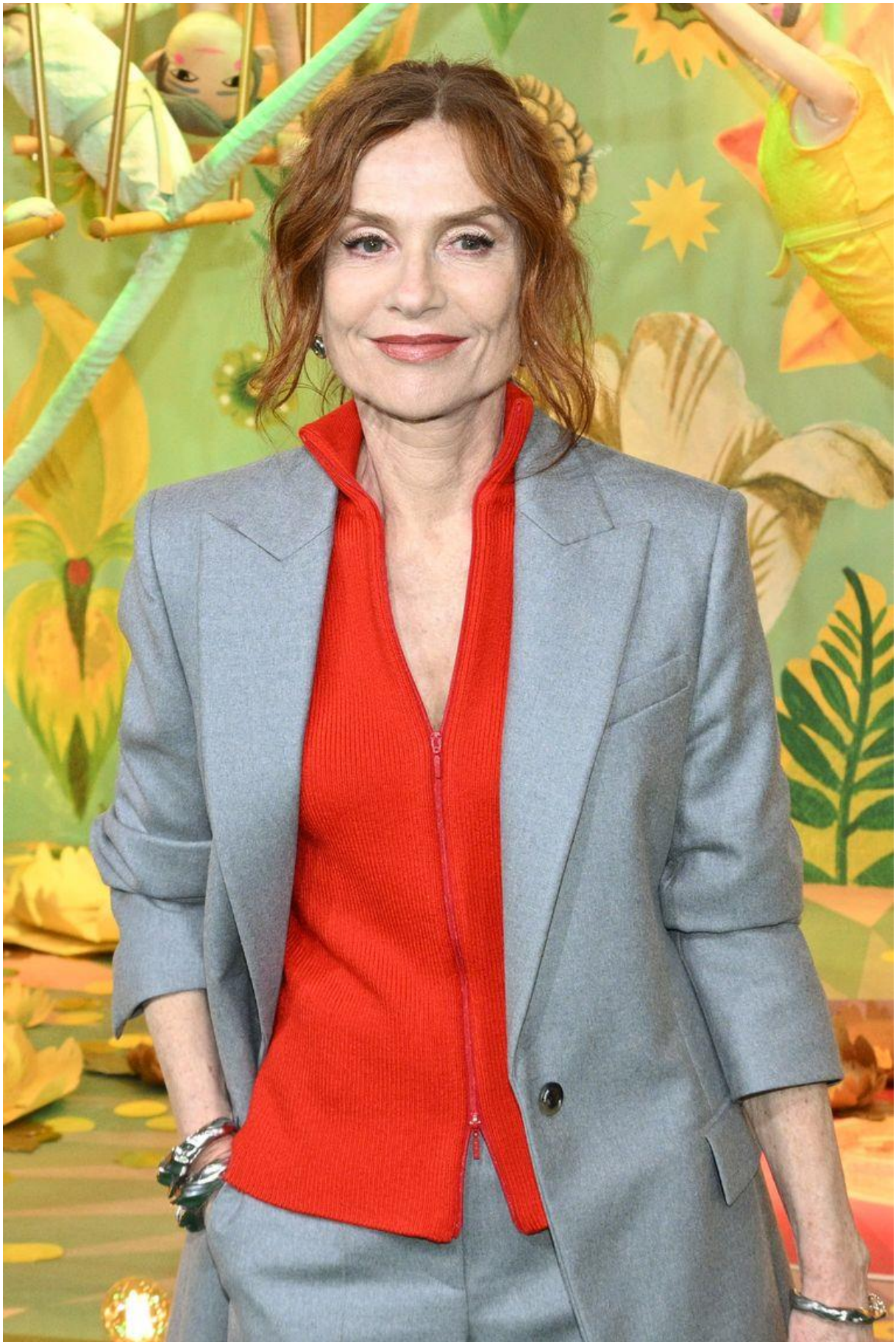
De Franse actrice Isabelle Huppert in 2022.