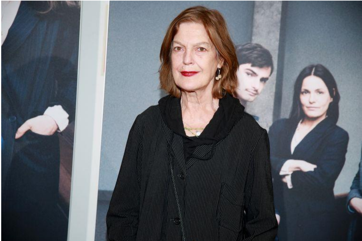
De Duitse actrice Angela Winkler in 2019.

Licht of zwaar, melancholiek of vrolijk: de afgelopen jaren werden heel wat kersenbomen omgehakt in het Nederlandse theater. Wat waren de beste versies van De Kersentuin die hier waren te zien?